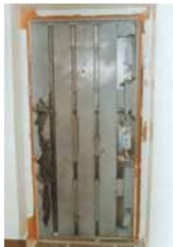
Hırsızın Açamadığı Kapı

8 yıldır her montajdan sonra müşterilerimize doldurduğumuz montaj bilgi formunda, müşterilerimizin görüş ve düşüncelerine kolaylıkla ulaşmaktayız.